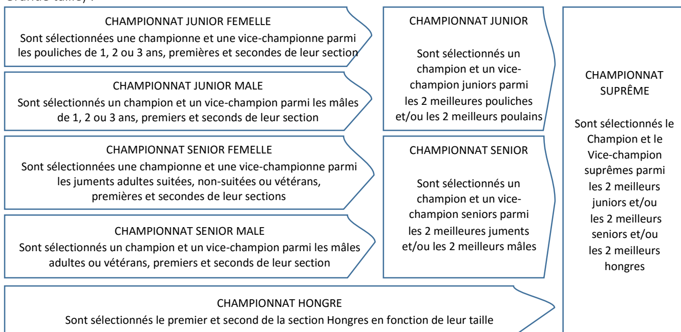
Schéma de l'organisation des championnats suprêmes, identique pour les 3 tailles (Mini, Intermédiaire et Grande taille) :

Les sections vétérans et hongres regroupant des poneys de taille et d'âge différents, ces derniers intègrent le championnat correspondant à leur catégorie de taille.