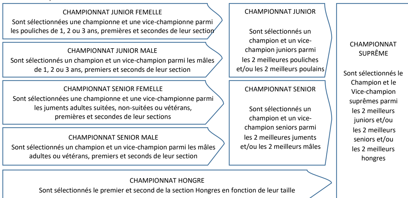
Schéma de l'organisation des championnats suprêmes, identique pour les 3 tailles (Mini, Intermédiaire et Grande taille) :

Les sections vétérans et hongres regroupant des poneys de taille et d'âge différents, ces derniers intègrent le championnat correspondant à leur catégorie de taille.